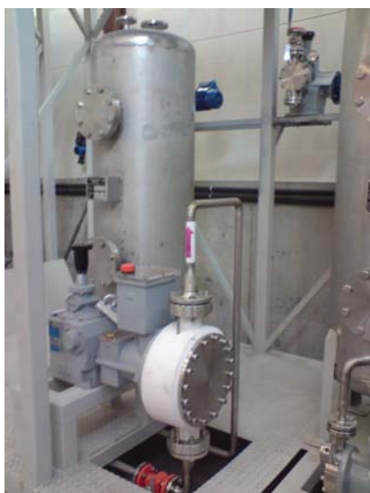
Hydraulisk membran doseringspumpe Pumpehode i PVDF materiale

Bilden nedenfor viser noen av pumpene Froster as leverte til Weyland sitt pilotanlegg. Pumpeleveransen bestod hovedsakelig av doseringspumper for sterke syrer.