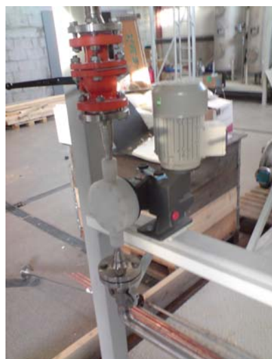
Mekanisk membran doseringspumpe Pumpehode i forsterket PP materiale